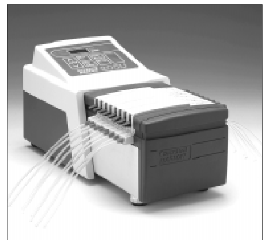
Afgebeeld: 205U/CA met 8-kanaals pompkop